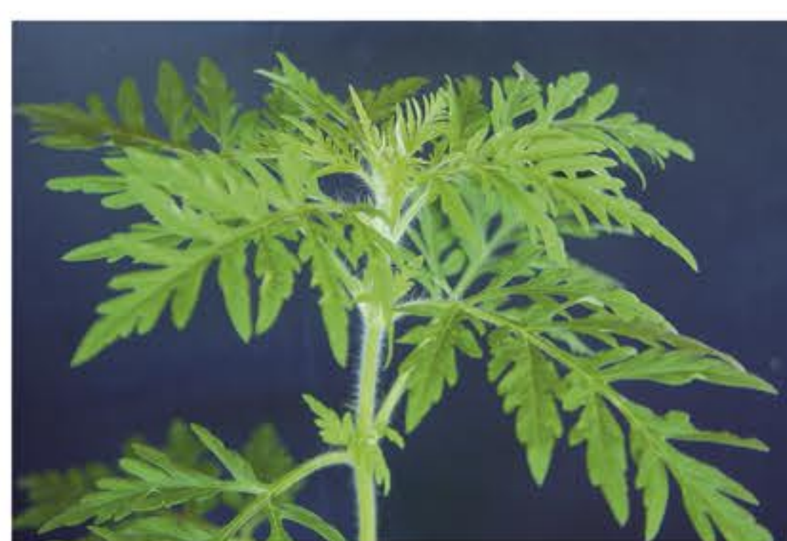
Fusto dell'Ambrosia Artemisiifolia

I FENOMENI ALLERGICI VANNO DALLE RINITI ALLERGICHE A PIÙ GRAVI DISTURBI RESPIRATORI E ALL'ASMA.