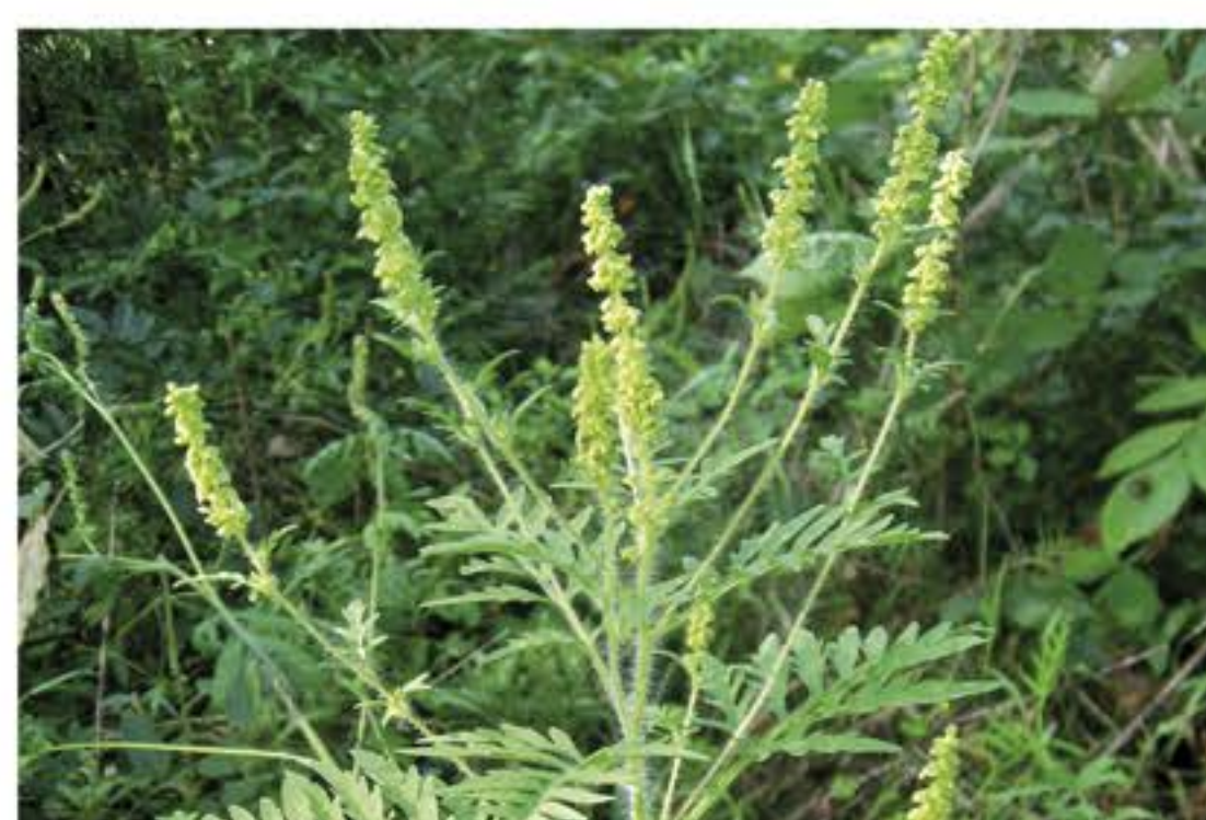
Fiore maschile dell'Ambrosia Artemisiifolia