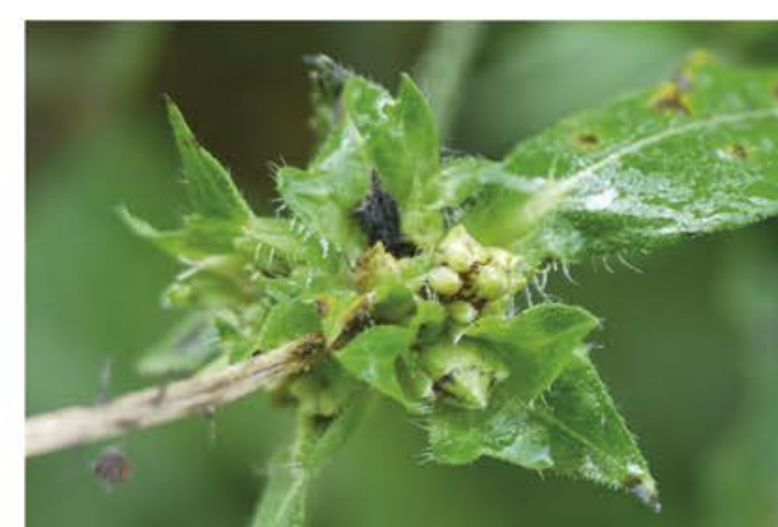
Fiore femminile dell'Ambrosia Artemisiifolia