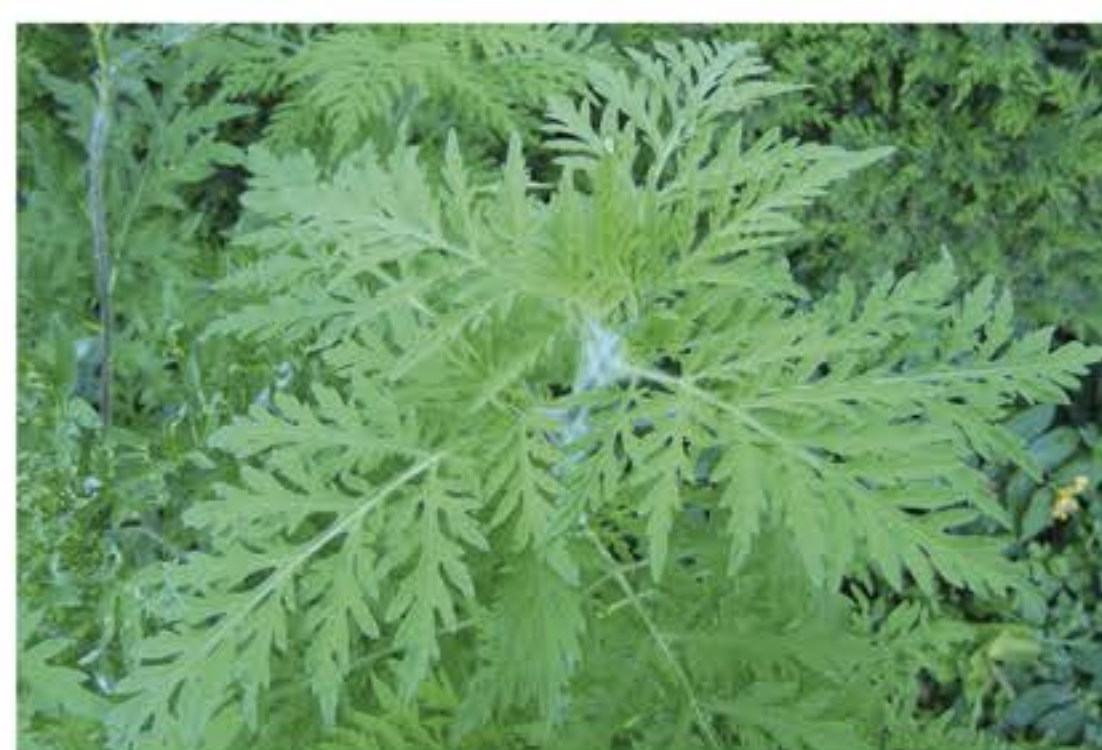
Foglia dell'Ambrosia Artemisiifolia