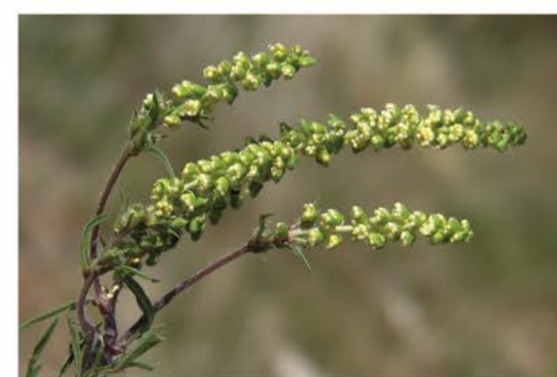
Fiore maschile dell'Ambrosia Artemisiifolia