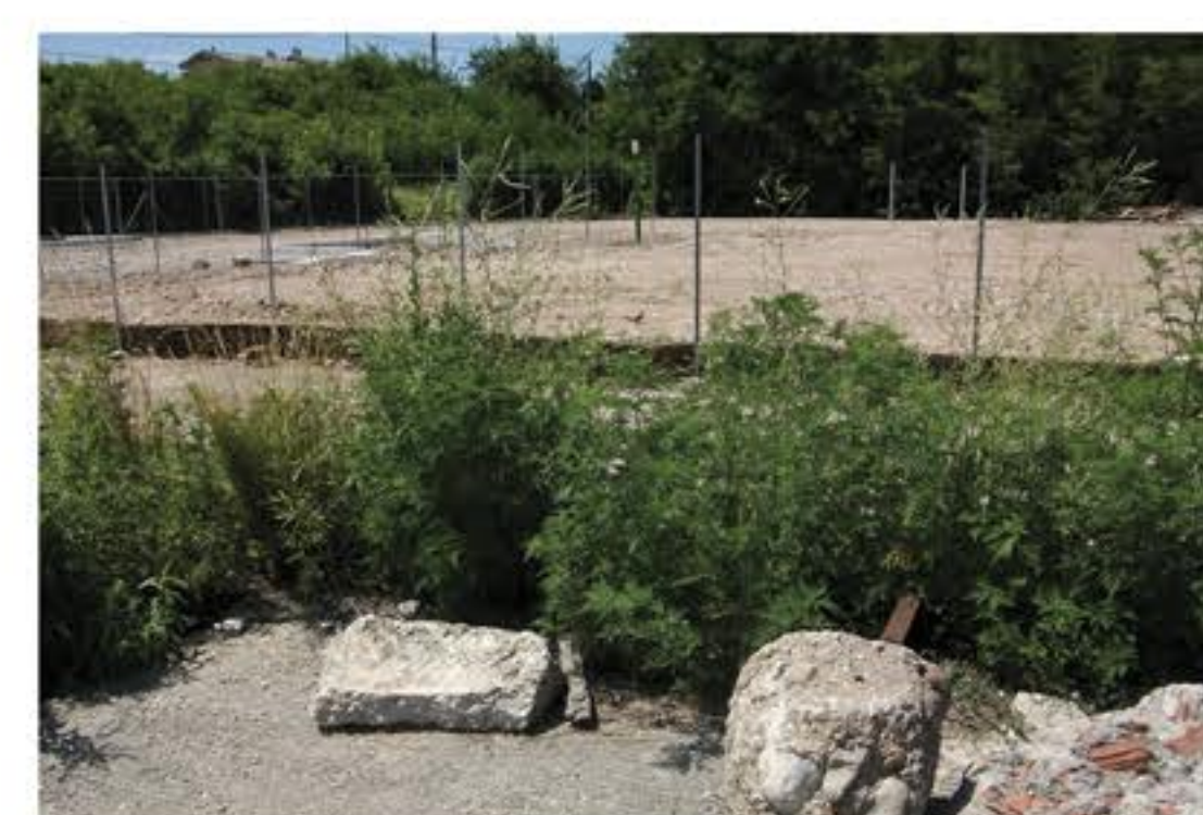
Habitat dell'Ambrosia Artemisiifolia