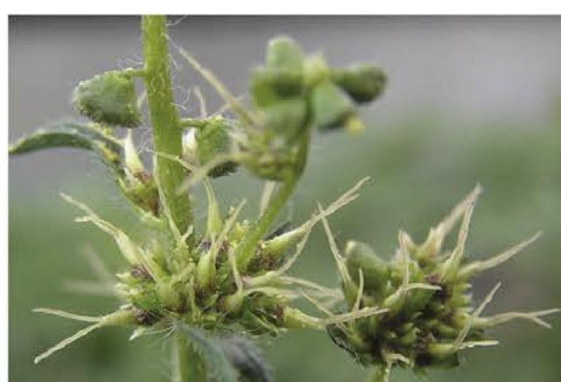
Fiore femminile dell'Ambrosia Artemisiifolia