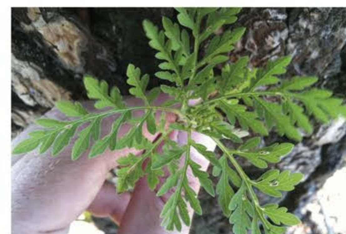
Foglia dell'Ambrosia Artemisiifolia