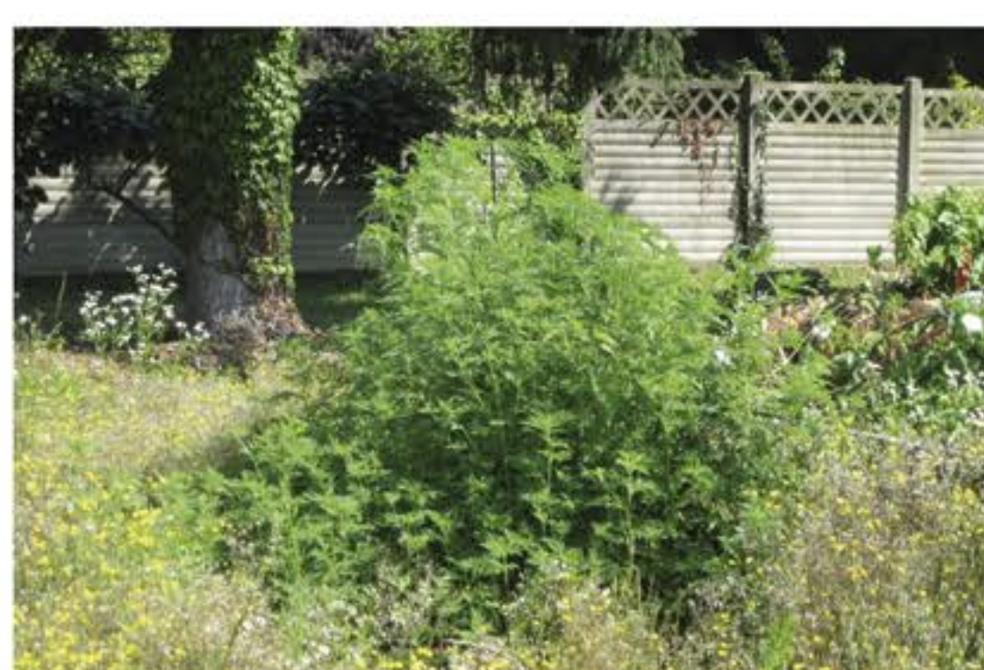
Habitat dell'Ambrosia Artemisiifolia